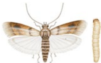
Fruktmott och mottlarv