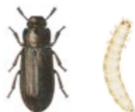
Mjölbagge och mjölbaggelarv