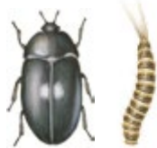
Pälsänger och pälsängerlarv