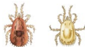
Kvalster och fågelkvalster