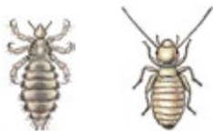
Klädlus och dammlus